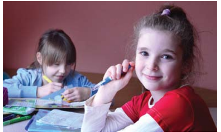
Vaikai augantys Jokūbavos šeimynoje turi kasdienių pareigų, žinoma, pirmą – pamokų ruošą, o vėliau reikia prisidėti ir prie buities darbų.